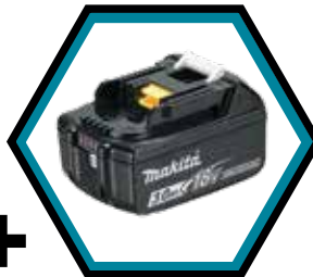
1x Akku 3.0 Ah (Art. 632G12-3)