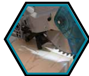
Eine integrierte LED-Lampe beleuchtet die Schnittlinie für eine höhere Präzision.