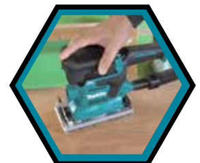
Schwingschleifer mit eingebautem Staubabsaugsystem.