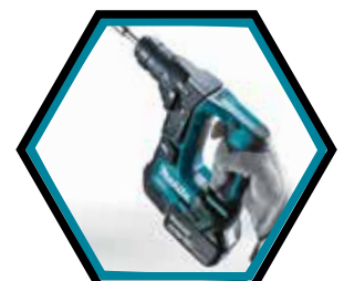
Kompakte, ergonomische und leichte Maschine.