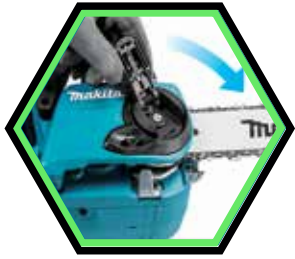
Kettenwechsel und Kette Anziehen ohne Werkzeug.