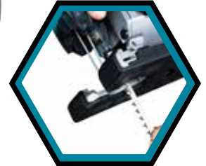
Mit werkzeuglosem Blattwechsel.