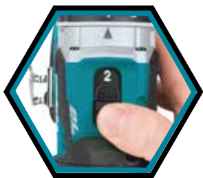
2-Gang-Getriebe mit Schlag.

Geliefert mit 2x Akkus 5.0 Ah, Schnellladegerät und Makpac-B Transportkoffer